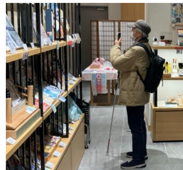
アプリを使用して ウィンドウショッピングをする様子

“視覚障害者信号機横断プロジェクト”チームと協力し、視覚障がい者用歩行支援アプリ・ツールの実証実験を2月1日(土)2日(日)に実施。日本橋エリアで10種類のツールを使用し、目的地までの安全な誘導はもちろん、視覚障がい者の自然な街体験を実現するべく、買い物シーンを想定した稼働中の商業施設での評価・検証を初めて実施します。当日は当社ビルに入居いただいている企業の社員の皆様にも参加いただきます。視覚障害者信号機横断プロジェクトチームと各ツールの詳細は、3Pをご覧ください。