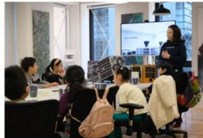
あつまれキッズ！宇宙の仕事ワークショップ