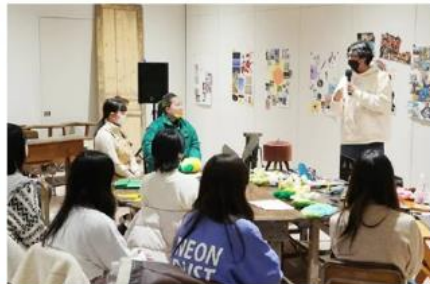
GAKU「グラフィックデザインのバトス」