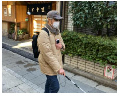
A.歩行支援アプリを使用して歩く様子 (2025年1月実施リハーサル時撮影)

※本レター記載の実証実験「ワクワクプロジェクト」、 「日本橋サステナSUMMIT テーマ別分科会」はプレスの皆さまにもご取材いただけます。詳細は、各ページのご案内をご覧くださいませ。