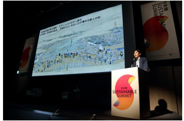
過去に開催した際の様子