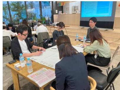
B.次世代育成交流会の様子 (2024年9月実施)

日本橋エリアでは、江戸時代から幾多の災禍を乗り越えてきた共助の精神や、企業や商店、人が互いに尊重・連携する共創のコミュニティが根付いてきました。また、当時の日本橋は東京市内有数の文教エリアでもあり、寺子屋や私塾など次世代の学びの場を提供してきた歴史もあります。