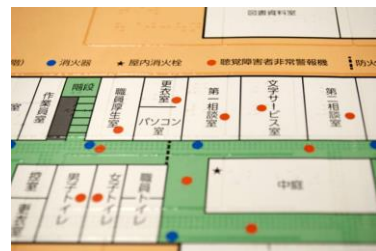
触知図イメージ(欧文印刷HPより)

触知図とは視覚障がい者や弱視者も指先で触れて情報を得られるよう表面に凹凸や点字を施した地図で、通行不可能な道を凸で表現したものが一般的です。一方、厚生労働省の調査※によると視覚障がい者のうち点字が読める人の割合は約10%とされており、従来の触知図は普段の街歩きに使用するには複雑という声もあります。これらの課題を踏まえ、今回はよりシンプルで点字を読めない人も使える「通行可能な道を凸で表現し、点字でなくQRコードで音声案内を行う触知図」の作成に初挑戦します。※厚生労働省：「平成13年身体障害児・者実態調査」