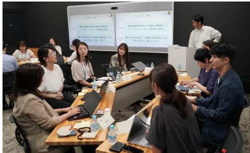
B.障がい者インクルージョン座談会の様子 (2024年9月実施)