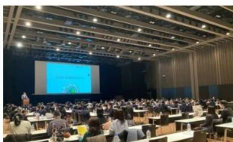
日本橋みらいスクール2023

開催レター： https://prtimes.jp/main/html/rd/p/000000680.000051782.html