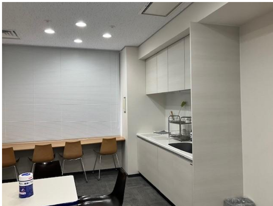
給湯室兼リフレッシュルーム